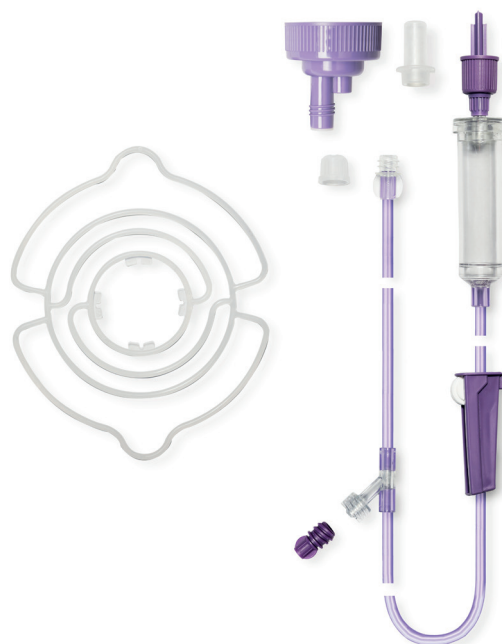
Flocare® Gravity Universal pose- og flasksett