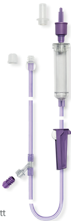
Flocare® Gravity™ sett

Flocare® Gravity sett er for tilkobling til alle Nutrison sondeernæringer og andre leverandørers sondeernæringer. Flocare® Gravity Universal sett er for tilkobling til både Nutricia og andre leverandørers sondeernæringsemballasjer. Ernæringssettet har ENFit-/ENPluskobling. Den lilla fargen skaper et klart skille fra administrasjonssett til parenteralt bruk. Alle Flocare® Gravity sett er frie for ftalater.