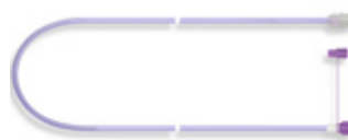
Flocare forlengelsessett 100 cm